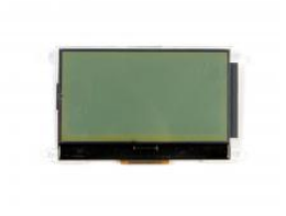
Display for IP master station board