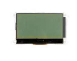
Display for IP master station board