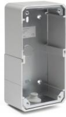
On Wall Back Box