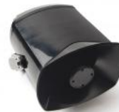
DSP-15 EExmN, 25W

Switched-mode power supply, 1- phase, 48 VDC output voltage, 2A current