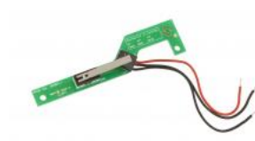
Tamper Switch for Vandal Resistant Substation TKIE