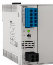
Power Supply 100- 240VAC/48VDC 2A

Convertisseur Ethernet Flowire - Tension CC