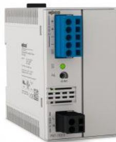
Power Supply 100- 240VAC/48VDC 2A

Convertisseur Ethernet Flowire - Tension CC