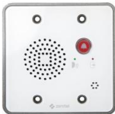
TMIS-1 | Mini Audio Intercom